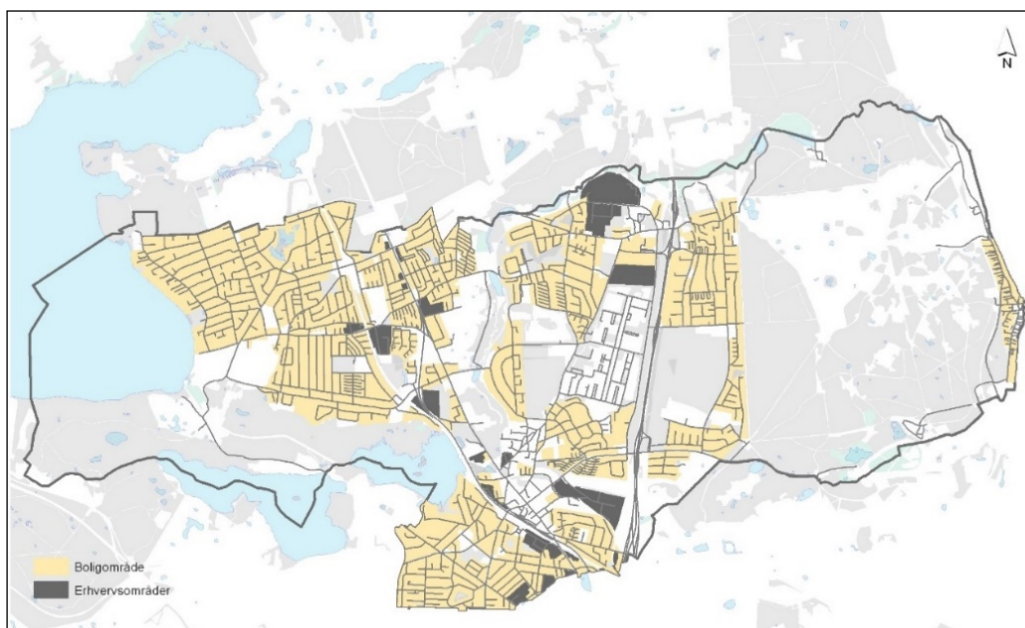
Figur 2: Kort over bolig- og erhvervsområder i Lyngby-Taarbæk Kommune

Da erhverv, landbrug og boliger mange steder ligger meget tæt på hinanden, skal der tages ekstra hensyn for at undgå bl.a. støj- og lugtgener fra erhverv og landbrug.