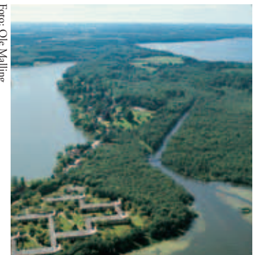
Centralt i billedet ses Fæstningskanalens udløb i Lyngby Sø. Til venstre Bagsværd Sø og øverst Furesø.