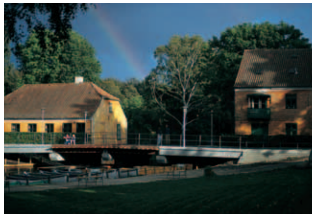
Møllen og slusen ved Frederiksdal.

I forbindelse med anlægget af fæstningskanalen blev møl- len eksproprieret for at give plads til en sluse.