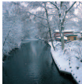
Fæstningskanalen ved Frederiksdal

Da man i 1886-94 opførte den københavnske landbefæstning, var idéen den, at man i tilfælde af krig på få dage ville føre 10% af Furesøens vand (11 millioner m 3 !) gennem Mølleåen til Lyngby Sø. Derfra skulle vandet via en gravet kanal oversvømme de naturlige lavninger, der strakte sig fra Utterslev Mose til Klampenborg. For at have styr på de store vandmasser måtte der bygges en række stemmeværker – det første ved Frederiksdal. Endvidere var det nødvendigt at rette Mølleåens mange bugtninger ud, og derfor har åen i dag karakter af en kanal.