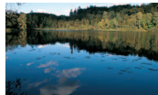
Den dybe og rene Store Hulso indgik i systemet af karpedamme i Frederiksdal Storskov.

Oprindelig var Kollekolle en lille landsby, der omkring 1850 blev lagt ind under én stor gård. I begyndelsen af 1900-tallet var Kollekolle drevet som mønsterlandbrug med forædling af Rød Dansk Malkerace. I dag er ejendommen uddannelses- og konferencecenter.