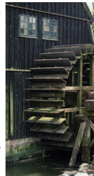
Vandhjulet på gavlen ved Lyngby Nordre Mølle.

Mølleåen forbinder de fire store søer: Bastrup Sø, Farum Sø, Furesø og Lyngby Sø. På sin 36 km lange vej til Øresund, har åen et fald på 29 m. Kombineret med en stabil vandføring, har det skabt grundlaget for, at der siden middelalderen har været opført en lang række vandmøller. Møllerne er blevet placeret, hvor terrænet gjorde det naturligt at lave passende opstemninger på åen. I åens nedre løb var vandføringen så stor, at møllerne fra 1600- til 1800 tallet kunne levere energi til nogle af Danmarks tidligste industrivirksomheder.