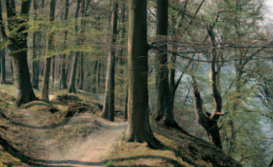
Vandrestien gennem skovene forløber langs den stejle skrænt ned mod Furesø.

Mellem Fiskebæk og Frederiksdal udfylder Furesø hele Mølleådalen og stierne er derfor tvunget ud til dalens skrænter (vandreruten) - eller op på plateauet oven for dalen (cykelruten). På cykelruten får man derfor ikke så meget indtryk af at færdes langs en ådal. Til gengæld vil man på turen opleve nogle meget smukke skove og en række spændende, kulturhistoriske seværdigheder.