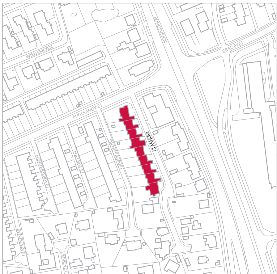
Mønsvej, mål 1:2.500