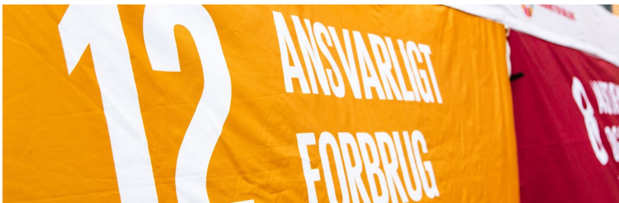
Det 12. verdensmål.