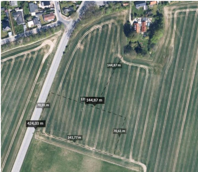
Figur 2. Oversigtsfoto med placering af oplagspladsen med ca. mål.

Oplagspladsen ønskes anlagt snarest muligt og ind til udgangen af 2028.