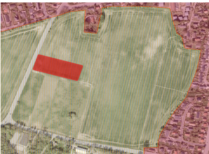
Figur 1. Placering af Oplagsplads. Oplagspladsen er markeret med rød firkant. Byzone er markeret med rød skrå skravering, mens landzone er med svag orange skravering.

Oplagspladsen placeres på matrikel 1a Frederiksdal, Sorgenfri på den østlige side af Frederiksdalsvej midt mellem Hummeltoftevej og Virum by, jf. figur 1. Der ansøges om en oplagsplads på ca. 70 m x 140 m dvs. ca. 10.000 m 2 for en periode i forbindelse med udrulning af fjernvarme til ca. 3000 kunder i Virum og Sorgenfri i Lyngby-Taarbæk Kommune. Udrulningen kræver adgang til lokalt placeret lagerplads med stor kapacitet.