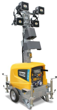
Figur 4: Billede af den type lamper som benyttes på pladsen.

Der opsættes 10 stk. lygtestandere fordelt langs hegnet, som lyser ind på pladsen. Oplagspladsen vil i lygtetændingstiden være oplyst med plads belysning. Lyset vil være udstyret med ur, så det kun er tændt i lygtetændingstiden inden for ansøgers normale arbejdstid. Lamperne er udstyret med teleskopmast, og højden på lamperne kan således justeres, så de giver færrest mulige gener.