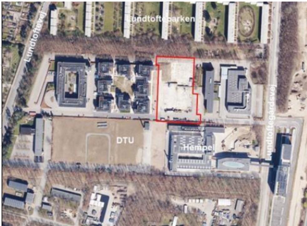
Billede 1: Placeringen af det ansøgte er markeret med rødt.

Ejendommen er placeret i et område hvor DTU og Hempel er syd for ejendommen og etageboligbebyggelse nord for ejendommen.